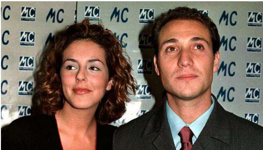
Rocío Carrasco y Antonio David Flores en 1999 cuando aún eran pareja

Jugar con algo tan absolutamente delicado. Estoy sobrellevando esta situación de la mejor manera que puedo, pero es muy complicado y lamentable. Estoy muy afectado, sobre todo por mis hijos ".