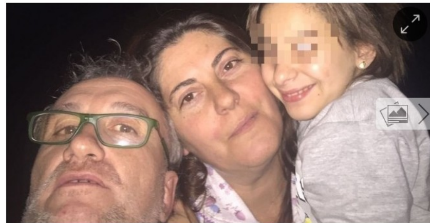
El Juzgado ordenó un registro en el domicilio familiar, que se realizó en presencia del magistrado y se alargó hasta medianoche.- ASOCIACIÓN NADIA NEREA