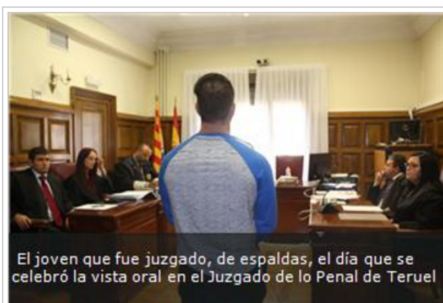
El joven que fue juzgado, de espaldas, el día que se celebró la vista oral en el Juzgado de lo Penal de Teruel