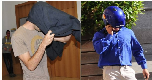
Los dos principales acusados, en las inmediaciones de los juzgados de Teruel. Uno de ellos, en el momento de acceder al edificio (izquierda). El otro, al abandonar las instalaciones judiciales.

Además, ha solicitado que se investiguen los teléfonos móviles de los imputados. De los dos principales encausados, uno de ellos no ha entregado el aparato al haberlo cambiado hace tiempo. En este momento la policía está obteniendo la información de 17 móviles. Por otra parte, la Fiscalía de Menores ha cerrado el expediente abierto a una joven que era menor y que también había sido imputada en el caso.